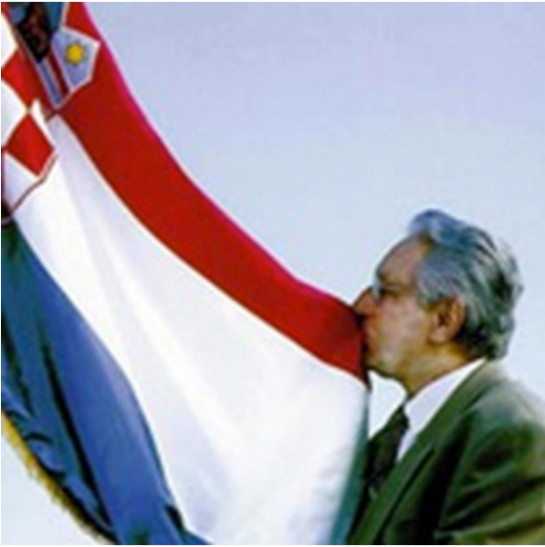
Ogledne fotografije dr. Franje Tuđmana